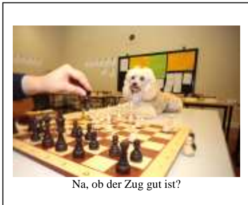
Na, ob der Zug gut ist?