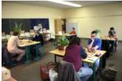
Meister gegen Talente

Heute endete nach vier Runden der Wettkampf „Meister gegen Talente“. Die Meister haben die beiden letzten Runden komplett gewonnen.