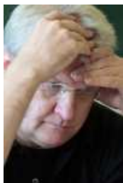
Das ist doch zum Haareraufen!